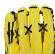
クロスレース・タイプ