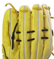
ダブルレース・タイプ